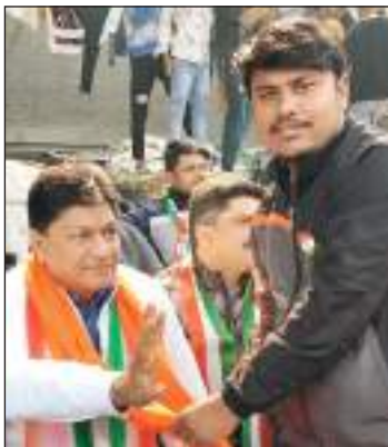
टीम एक्शन इंडिया/नई दिल्ली दिल्ली के कोशलपुरी इलाके में जिला चांदनी चौक भाजपा पूर्वांचल मोर्चा के द्वारा गणतंत्र दिवस के अवसर पर स्टेशनरी